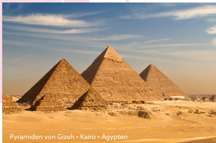
Pyramiden von Gizeh • Kairo • Ägypten