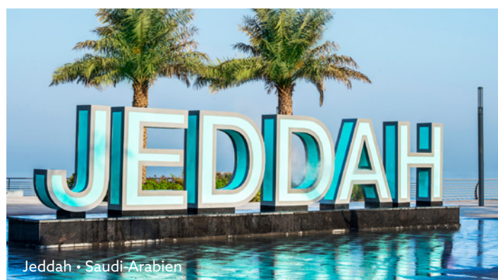
Jeddah • Saudi-Arabien

Setzen Sie Ihre malerische Fahrt zur Schwimmenden Moschee fort und freuen Sie sich auf einen Fotostopp am ikonischen Jeddah-Schild. Als abschließendes Highlight wartet der majestätische König-Fahd-Brunnen mit einer faszinierenden Wassershow auf Sie.