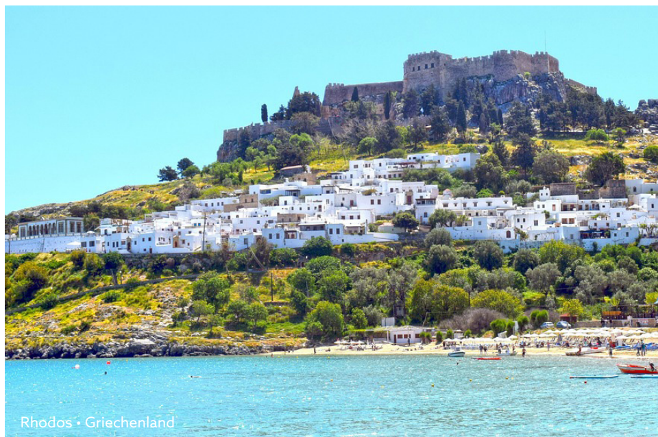
Rhodos • Griechenland

Die An- und Ablegezeiten sind Richtzeiten. Änderungen der Reiseverläufe und Ausflugsprogramme bleiben vorbehalten. Je nach Wetterbedingungen oder behördlichen Vorgaben entscheiden der Lotse und der Kapitän über die bestmögliche Durchführung des Reiseablaufes. Die aufgeführten Ausflüge sind ein Auszug der möglichen Landaktivitäten. Sobald die Details zum Ausflugsprogramm feststehen und Ausflüge verbindlich reservierbar sind, benachrichtigen wir gebuchte Gäste unaufgefordert schriftlich. Die Bezahlung erfolgt an Bord.