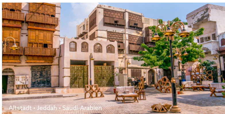
Altstadt • Jeddah • Saudi-Arabien