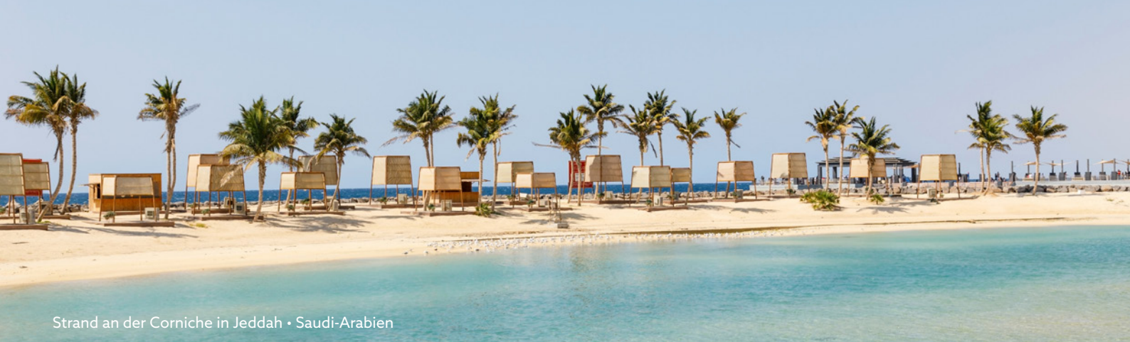
Strand an der Corniche in Jeddah • Saudi-Arabien