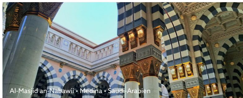
Al-Masjid an-Nabawi • Medina • Saudi-Arabien