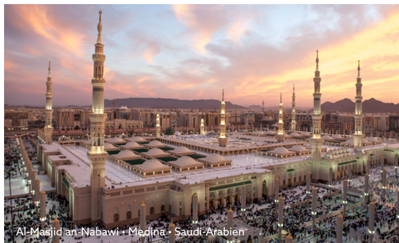
Al-Masjid an-Nabawi • Medina • Saudi-Arabien