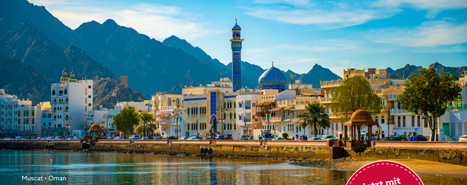
Muscat • Oman

Jetzt mit Überland- programm Saudi-Arabien!